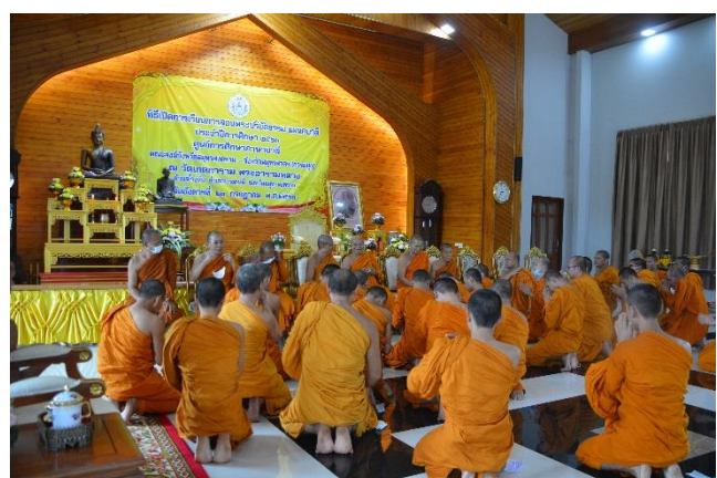
ภาพบรรยากาศพิธีเปิดการเรียนการสอนพระปริยัติธรรมแผนกบาลี