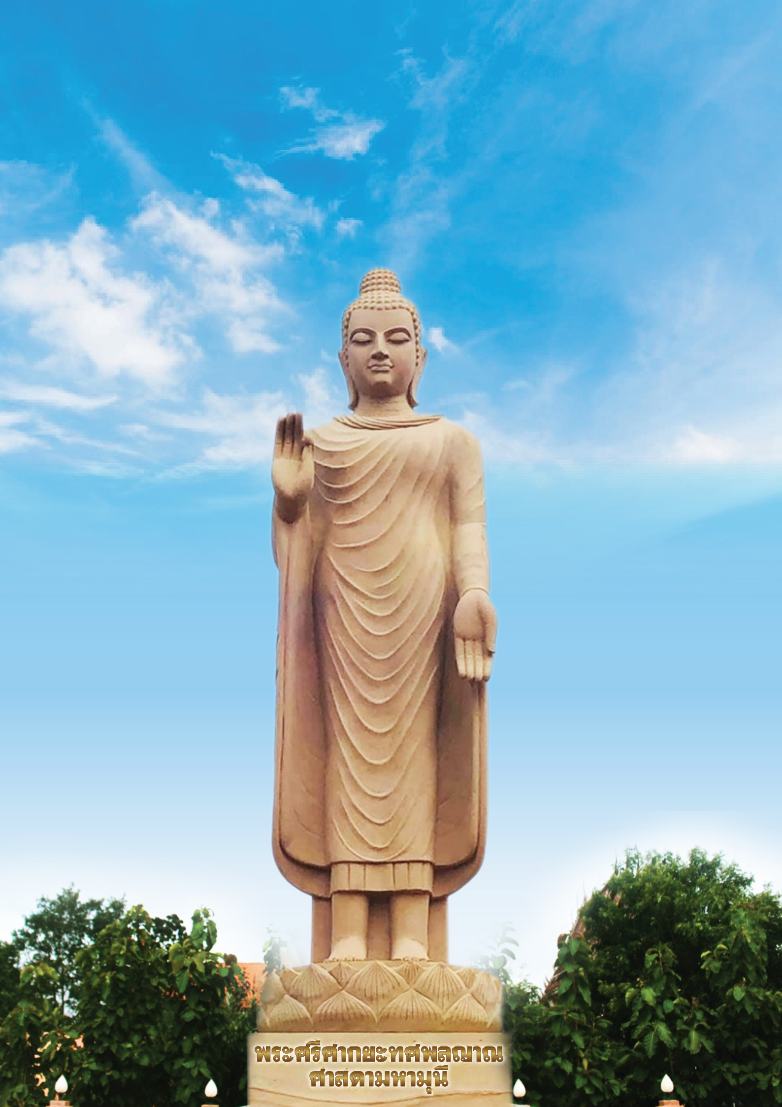
พระศรีศากยะทศพลญาณ ศาสดาามหามุนี